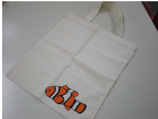
エコバックを 持つ～ \(\wedge\wedge)\)